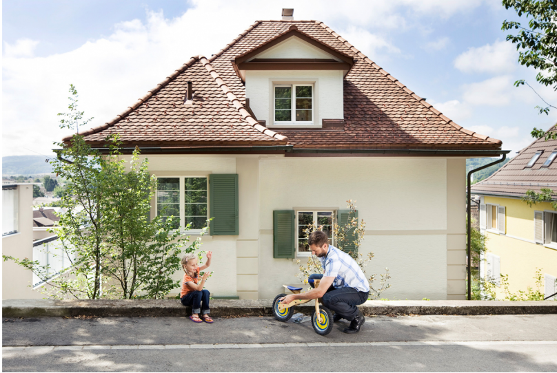
Das Gebäudeprogramm Corporate Image

While the various cantons have been responsible for implementing the Federal Building Program and communicating their funding conditions since the beginning of 2017, EBP continues to manage the national website for the Federal Building Program.