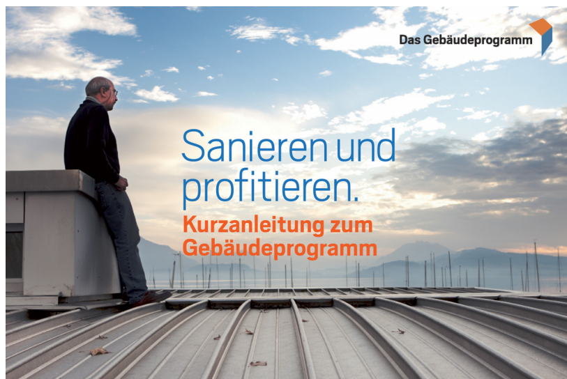
Das Gebäudeprogramm Leporello