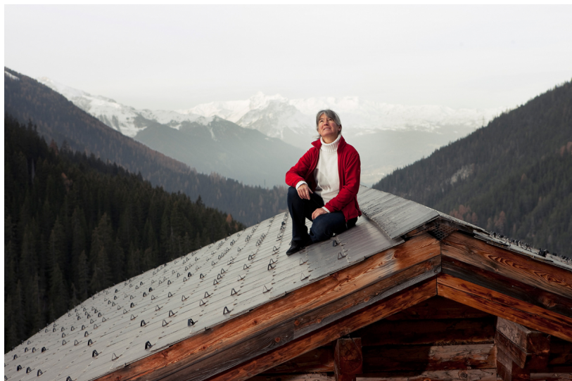
Das Gebäudeprogramm Corporate Image