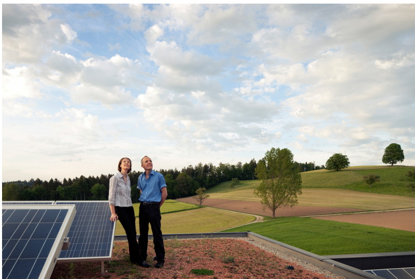
Das Gebäudeprogramm Corporate Image