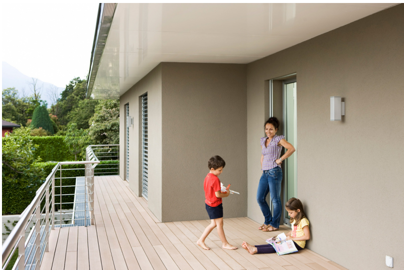
Das Gebäudeprogramm Corporate Image