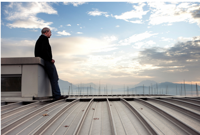
Das Gebäudeprogramm Corporate Image