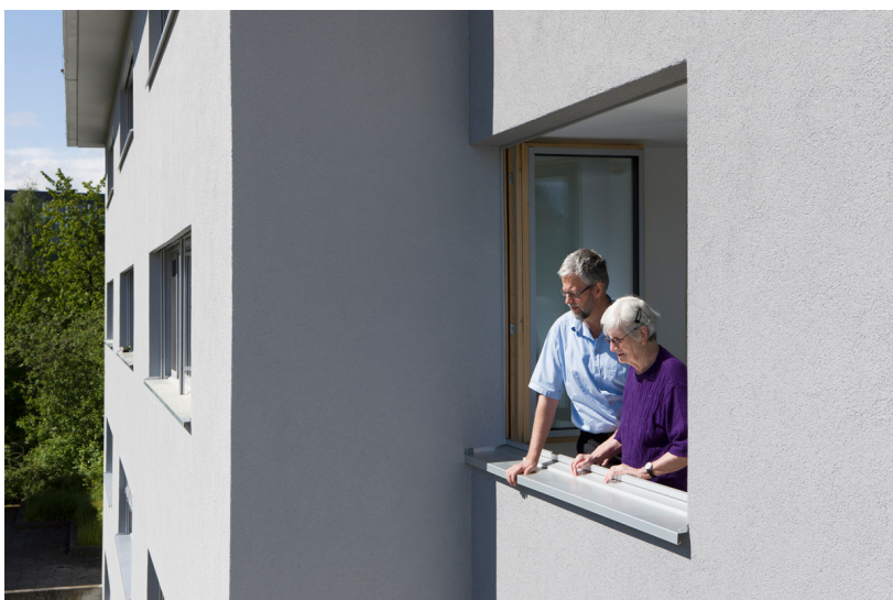
Das Gebäudeprogramm Corporate Image